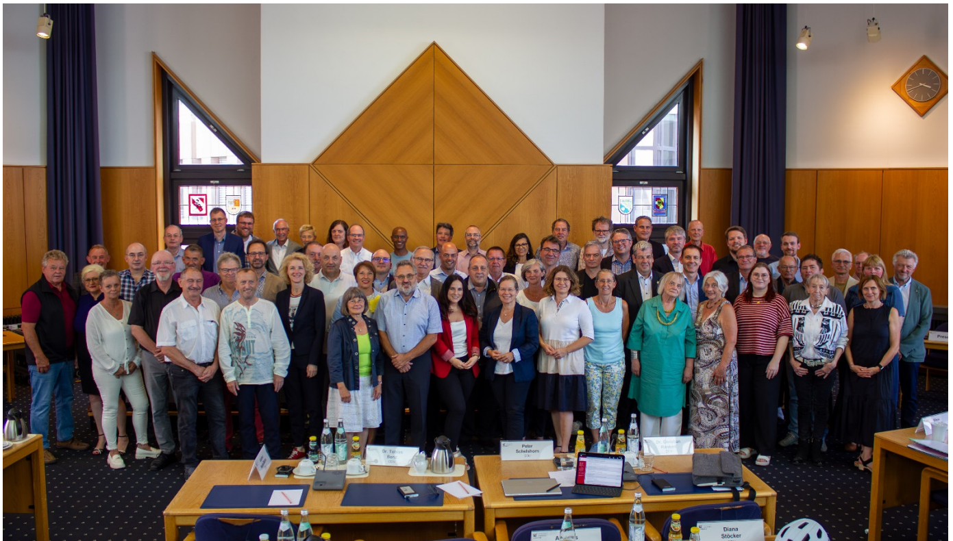
Kreistag zum Zeitpunkt der Konstituierung am 09.06.2024

Beschließende Ausschüsse, Vertreterinnen / Vertreter in Organen anderer juristischer Personen, sonstige Gremien